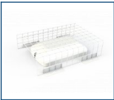
Защитная решетка Луна (300*200*70)